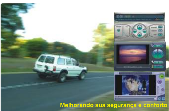
Melhorando sua segurança e conforto